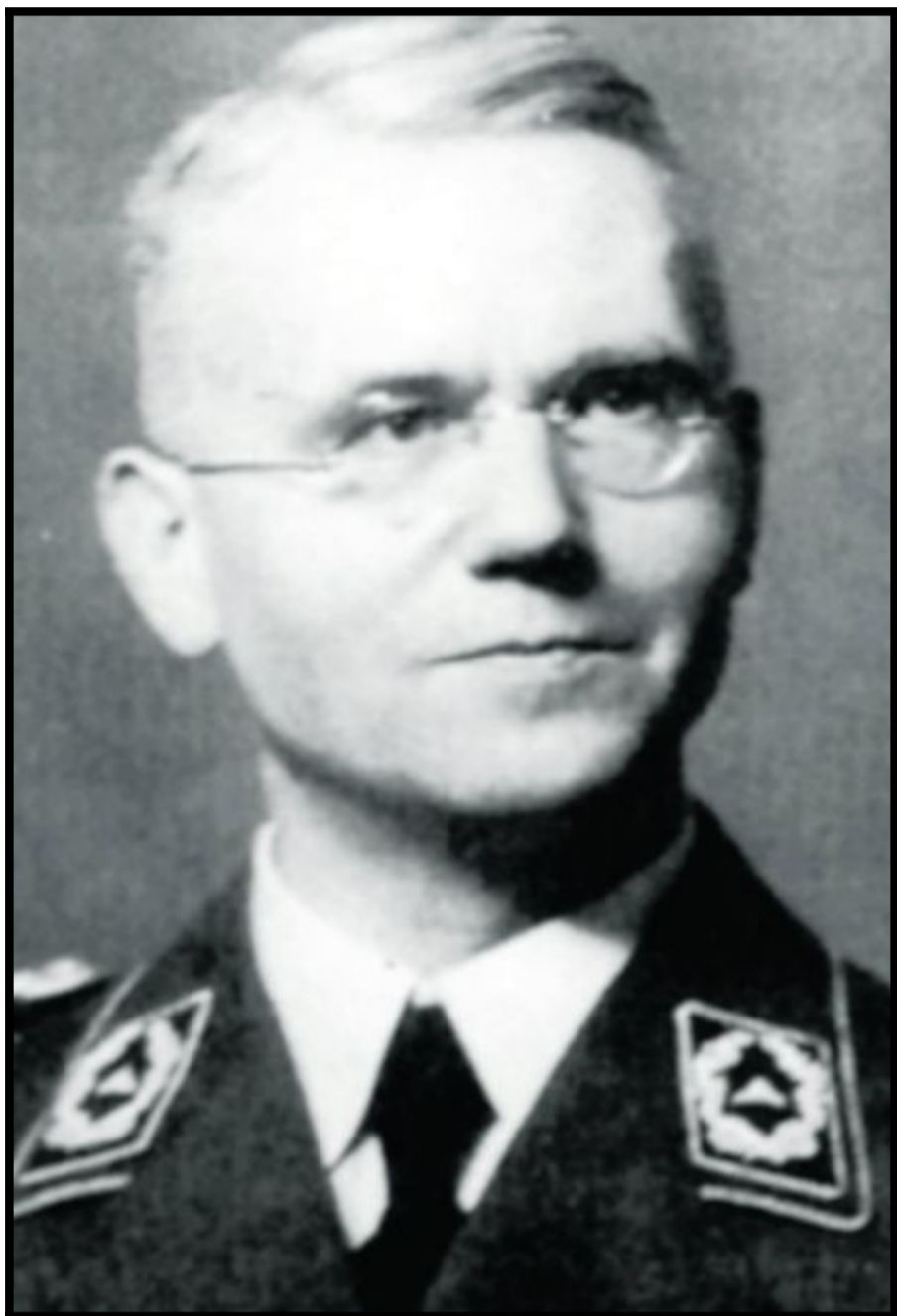
DØDENS DOMMER: De fleste dødsdommene mot nordmenn ble avsagt av tyske dommere, som president i Reichskriegsgericht Walther Biron. Han avsa 31 dødsdommer mot nordmenn under krigen.